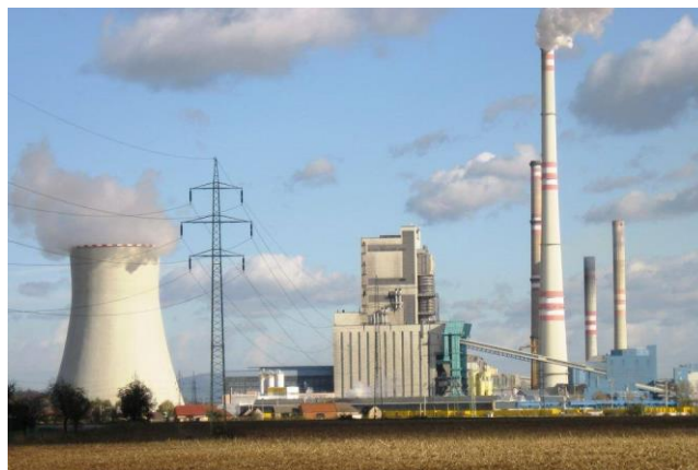
Elektrárna Mělník I, II, III