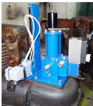
Blok individuálního řízení VTRV a snímače polohy