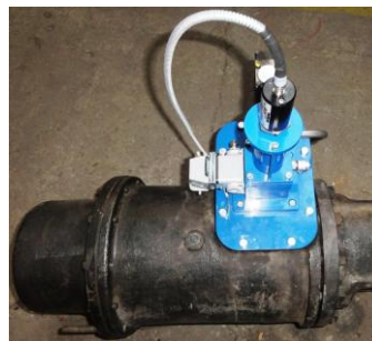
Řídicí blok NTZV