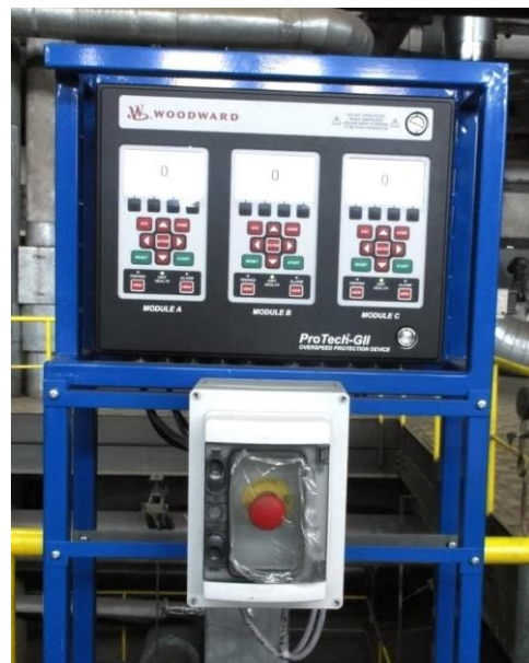
Otáčková ochrana Woodward ProTech GII a odstavovací tlačítko