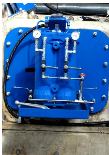
Duplexní filtr regulačního oleje